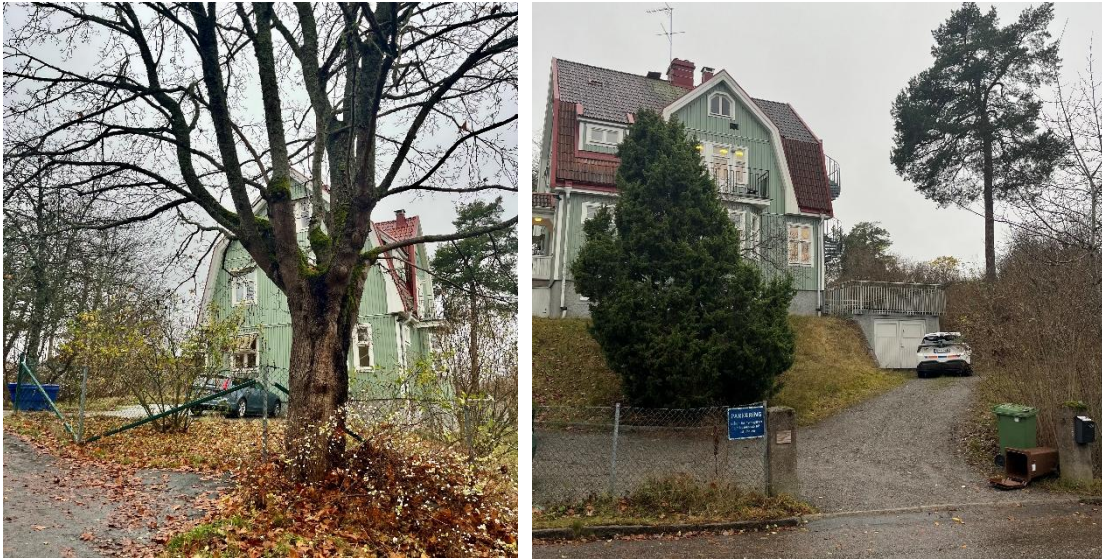
Figur 1. Lönnen till vänster och tallen till höger i bild.