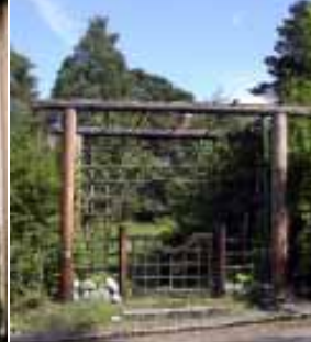
7. Cyrillus Johanssons trädgård.